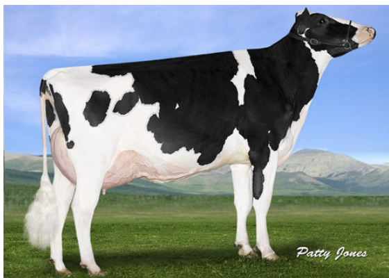
EDG RUBY UNO RIZA GRANDDAM