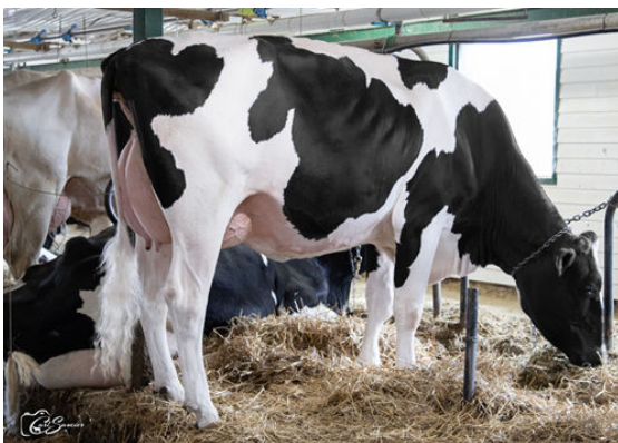
ROULEAU FOX SPECIAL