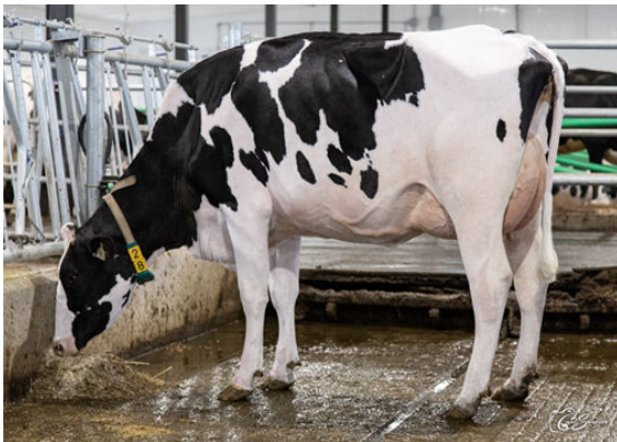
VAUDAL FOX FAWN