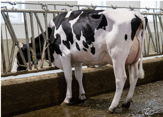
VAUDAL FOX FAWN