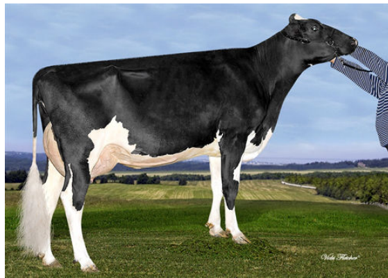
STE ODILE SUPERSHOT ELECTRA