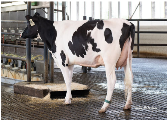
STANTONS GALORE CREAM

L-R STANTONS GALORE BEQUITA, SABLE, CREAM AND EVIE