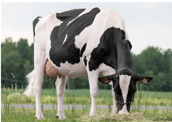
FRONTIERES LOLLY GALORE