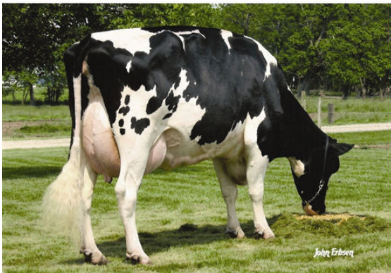
CROCKETT-ACRES MTOT ELLY