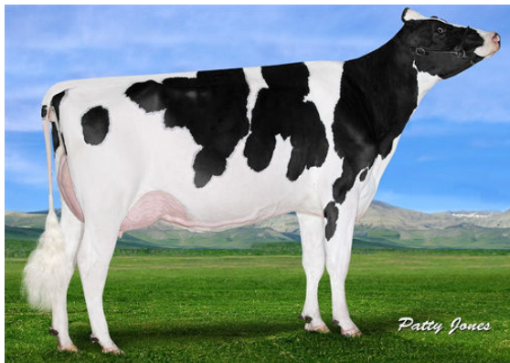
IHG JACEY GRACE DAM