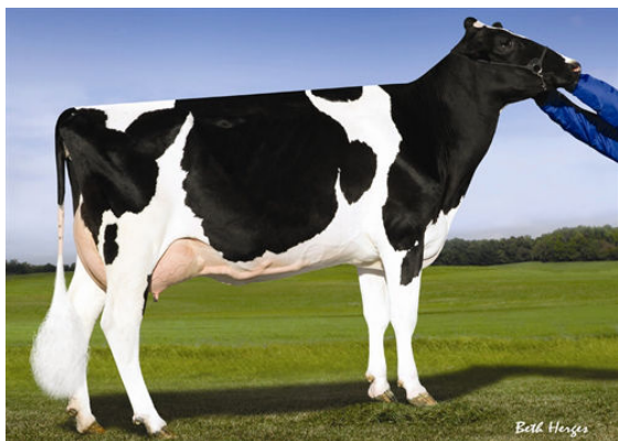
PINE-TREE 2149ROBST 4846