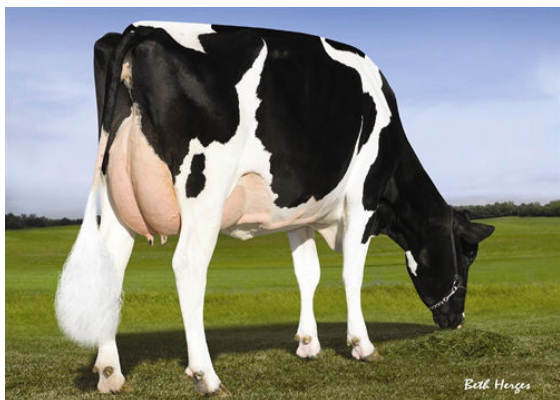
PINE-TREE 2149ROBST 4846