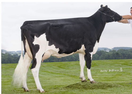
PINE-TREE ZENITH SHEEN