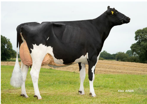
HAH 28552 DAUGHTER