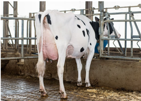
WRICO GYMNAST TILDA DAUGHTER