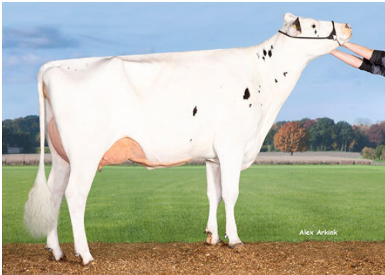
K&L OH ROZELLA DAUGHTER