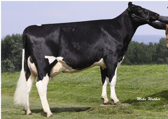
COYNE-FARMS FREDDIE JILL