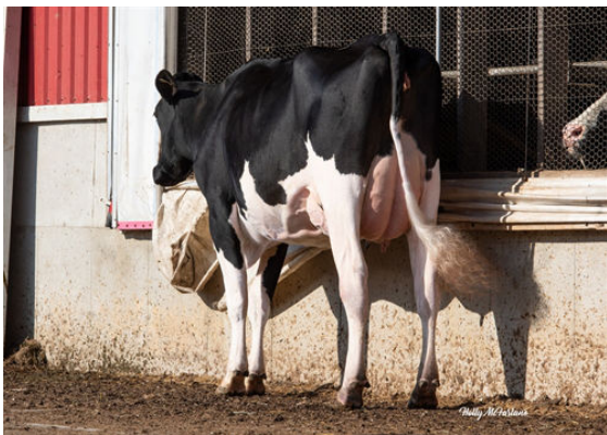
FRAELAND APPRENTICE APOLOGY