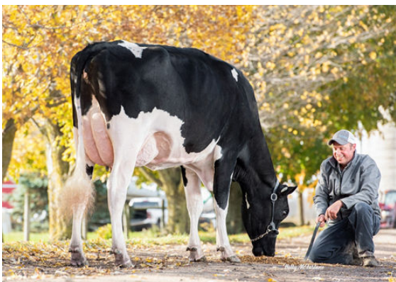
FRAELAND APPRENTICE APOLOGY