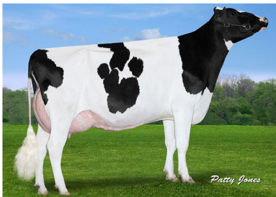
VIEW-HOME MCC FOUND