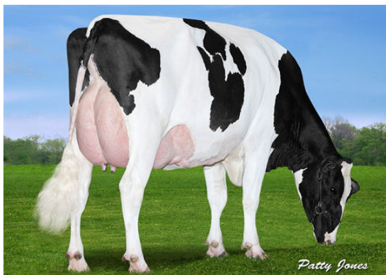
VIEW-HOME MCC FOUND