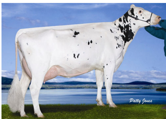
WABASH-WAY EVETT FOURTH DAM