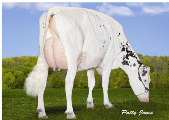
VELTHUIS S G SNOW EVENING GRANDDAM