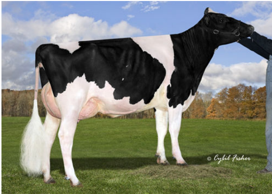
SIEMERS MOGUL APPLE-STAR