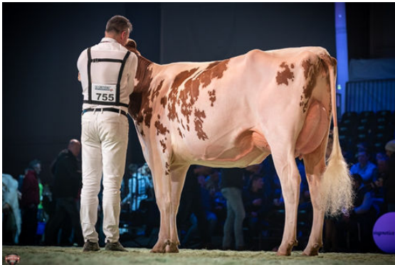
ALL-STAR AGENT ELEGANCE