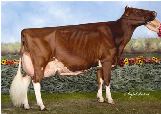
KHW REGIMENT APPLE-RED