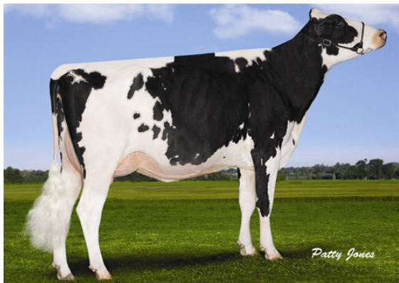
RAINYRIDGE SUPER BETH