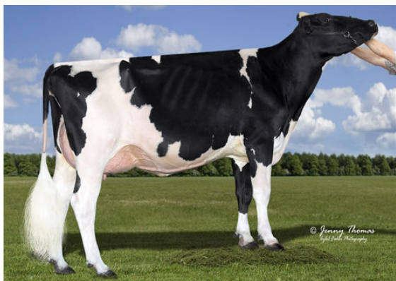
CALBRETT SUPERSIRE BARB