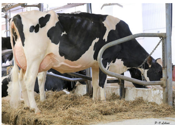
LEHOX DEALMAKER RALIE