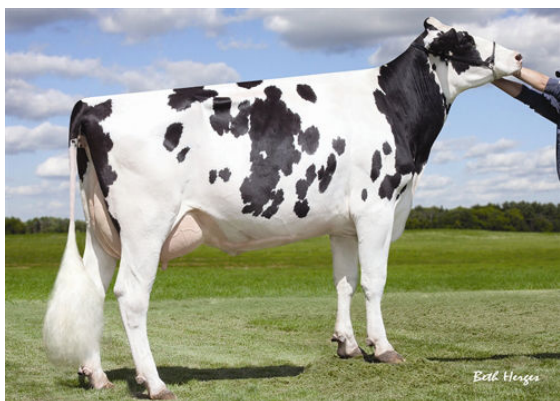
SULLY SHOTLE MAY-TW