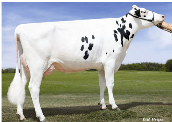
DYMENTHOLM SUNVIEW SCOBY