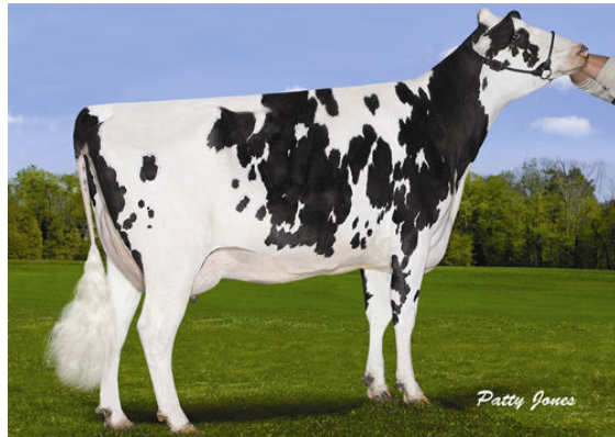
STANTONS SUPER ELDA