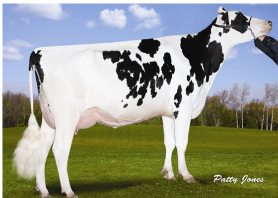
MS LOOKOUT PESCE NEVA DAM