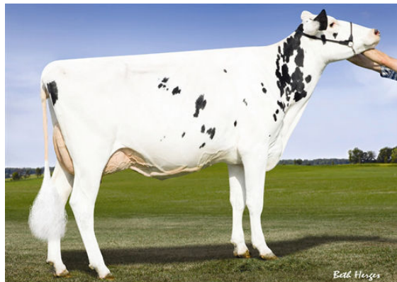
LEADERWIN SNOMAN MYSTERY