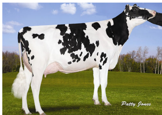
OCD MOGUL FUZZY NAVEL