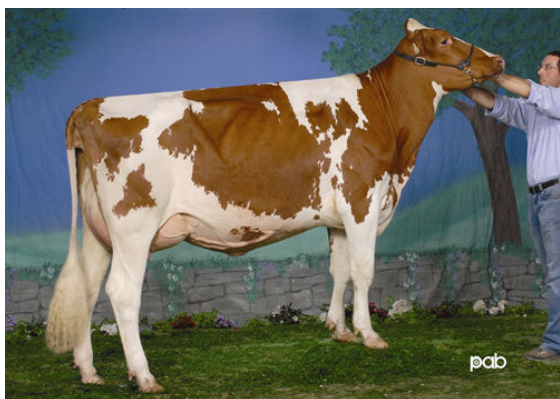
GEN-I-BEQ TALENT SPECTRA