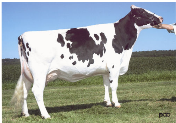
GLEN DRUMMOND SPLENDOR