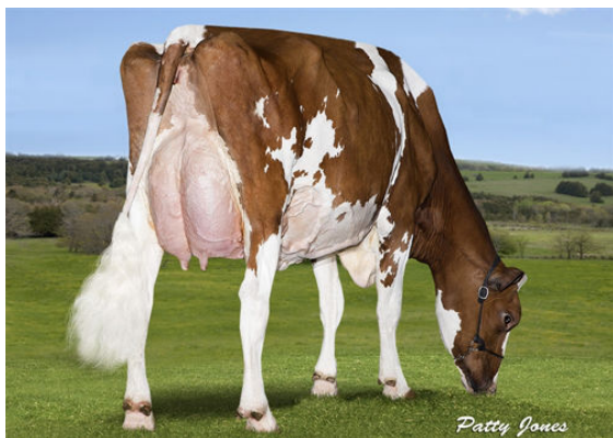
CHARPENTIER DESTROY SENSASS