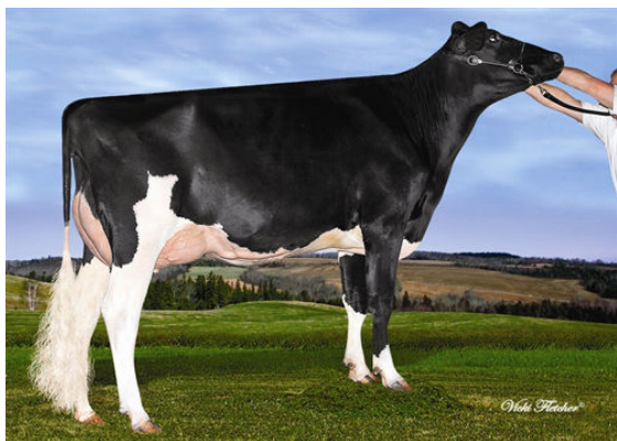
LINDENRIGHT BRADNICK MOOVIN ON