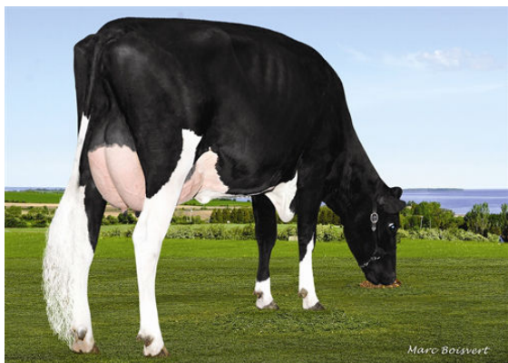
LEOTHE SUDAN DIFFERANTE