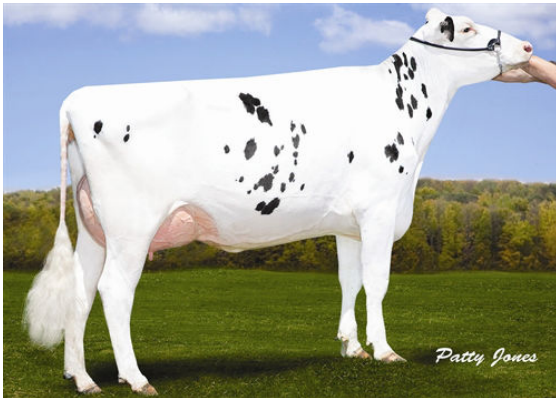
SPRINGHILL-OH ROCK ARIANNE