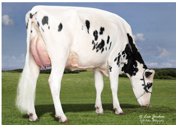
EVANS-H BYWAY JAMISEN