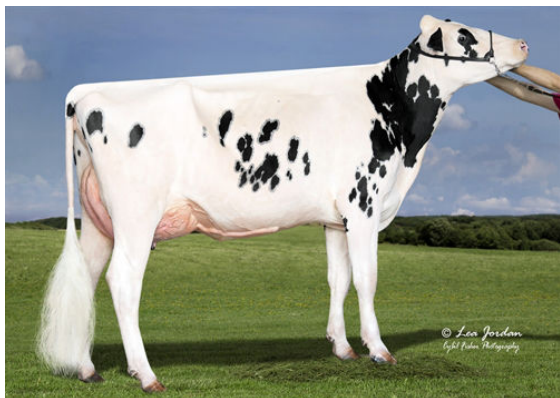
EVANS-H BYWAY JAMISEN