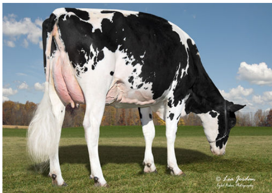
HEATHERSTONE JUST DO IT