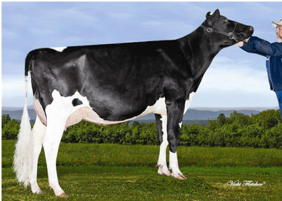
WELCOME BRONCO PATRON