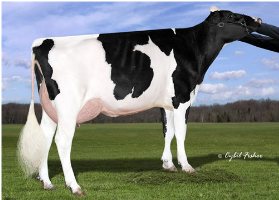
SIEMERS DELTA S-ROZ-ANN