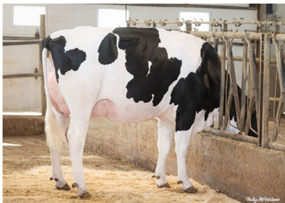
PROGENESIS RANGER ANTHEM DAUGHTER