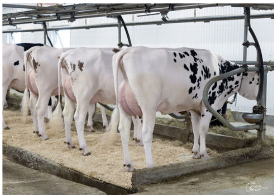
RANGER DAUGHTER GROUP DAUGHTER