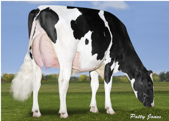
MAPEL WOOD CGAIN LOTTO P