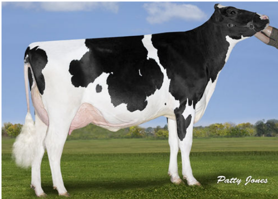
MAPEL WOOD CGAIN LOTTO P