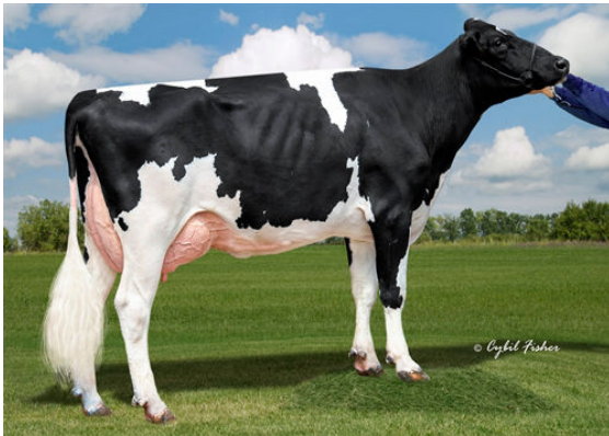
AOT MARK HIGHSTRUNG DAUGHTER