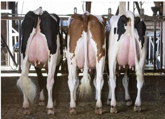
WILDER MARK DAUGHTER GROUP DAUGHTER