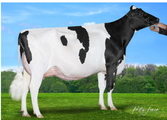
CLAYNOOK ZESTY MARK DAUGHTER