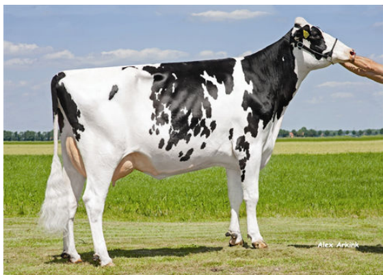
EPIC JULIANA DAM