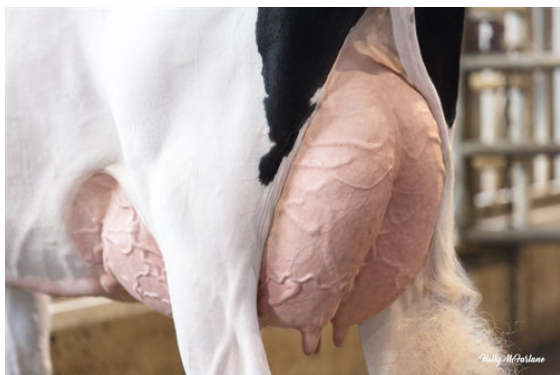
PROGENESIS ZAZZLE PUZZLE