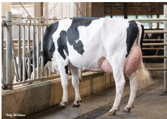
PROGENESIS ZAZZLE PUZZLE