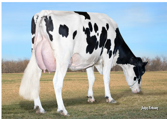
S-S-I BOOKEM MODESTO 7269 FIFTH DAM