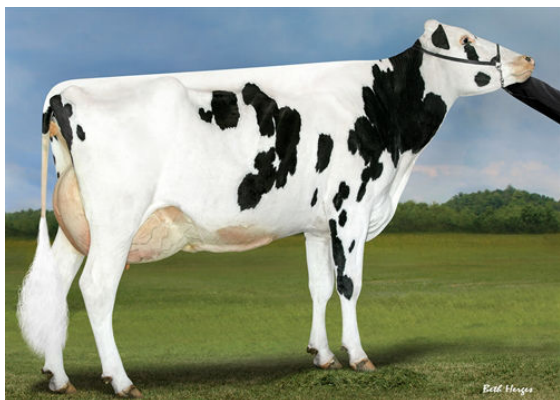
PROGENESIS DUKE MELEE