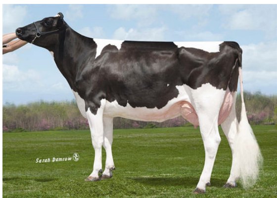
SULLY PLANET MANITOBA