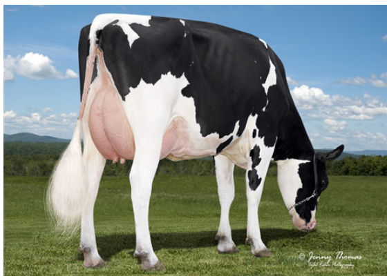
BRIGEEN PRESIDENT 2488