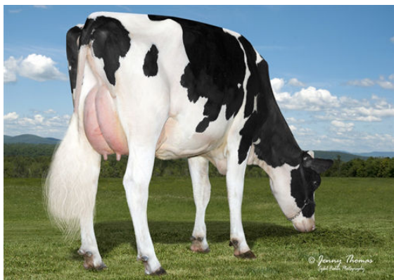
BRIGEEN PRESIDENT GIGGLE