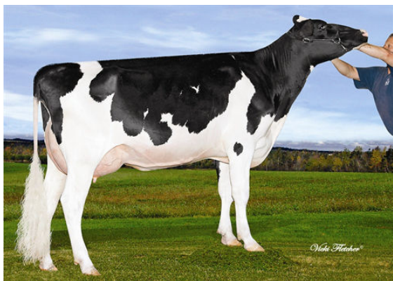
DELABERGE OMAN DOILEE