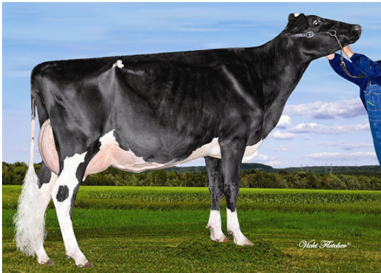
SIEMERS DMAIN BRILLIANCE