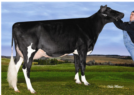
VALLEYCLAN PINKMAN KALICIE