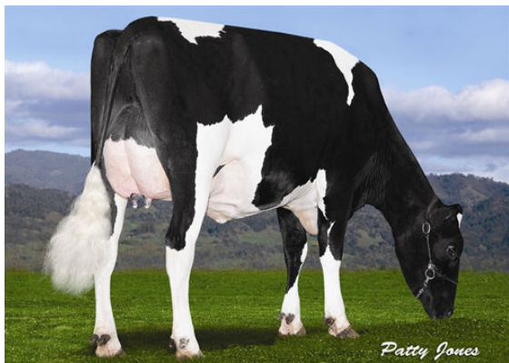
DOLPHIN PINKMAN 861