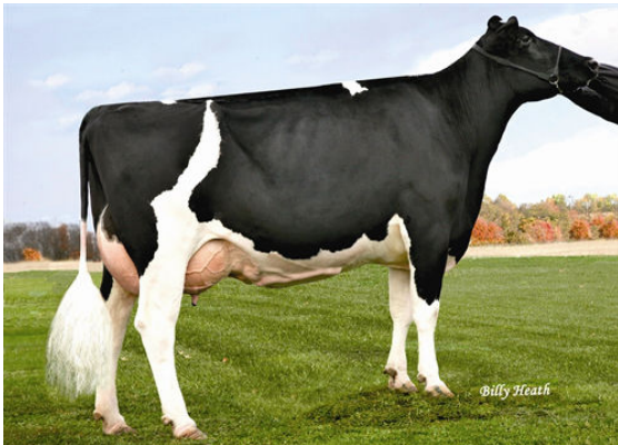
NO-FLA OMAN HEIDI 20611 Dam