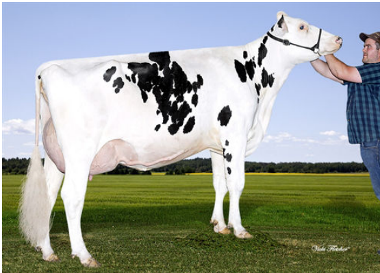
BEAULAIN ACCELERATOR ROLLIE