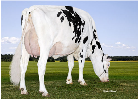
BEAULAIN ACCELERATOR ROLLIE