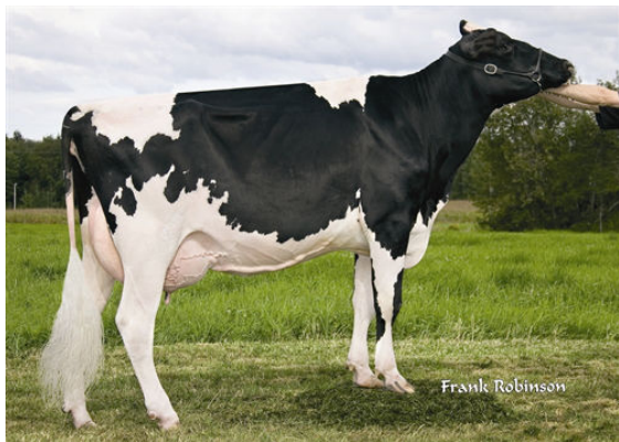
GEN-I-BEQ CHAMPION BAMBI GRANDDAM