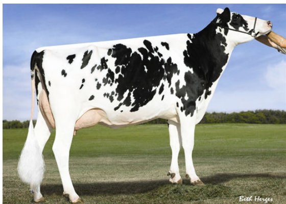
OCONNORS SUPER BABY DAM