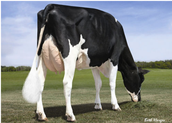
KELLERCREST MANOMAN LACY