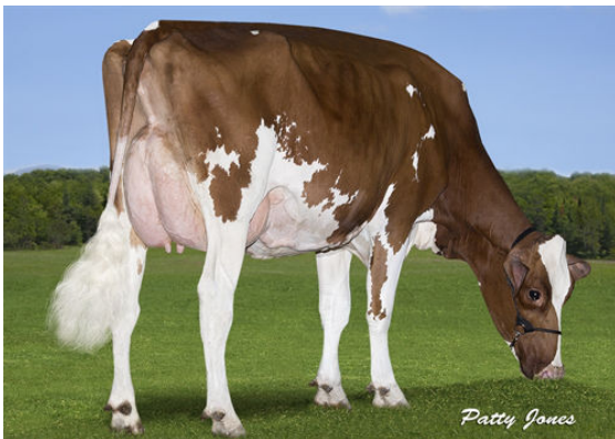
GREENVIEW SYMPATICO JOLENE