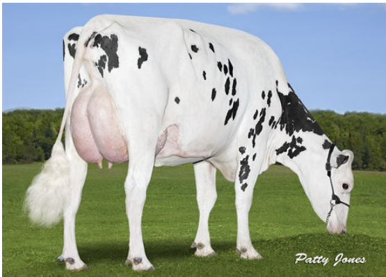
SUMMITHOLM SYMPATICO TORNADO