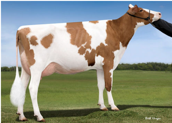
SNOWBIZ SYMPATICO SOFIA-RED