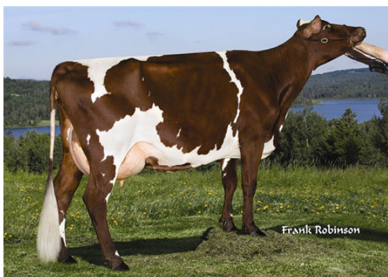
KAMOURASKA POKER RUBIS GRANDDAM