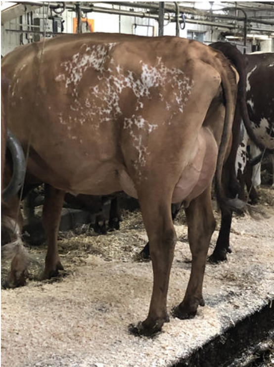
LA CROISEE TUXEDO FLASH