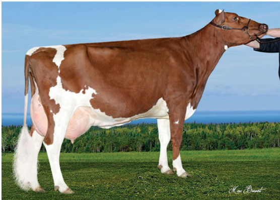
MARGOT CHOCOLATE DAM