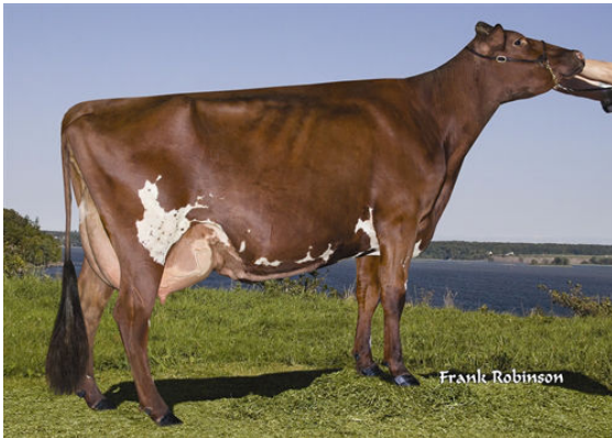
MISYL NORMANDIN JANELLE GRANDDAM