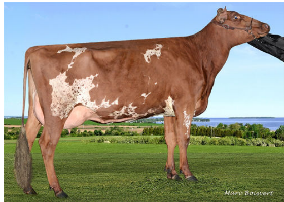
DUO STAR AMICALE