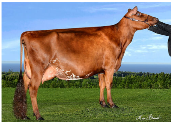
DES ROCHES BIGSTAR DOLCE